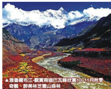
▲雅魯藏布江-觀賞南迦巴瓦峰欣賞10-11月秋季奇觀、醉美林芝雪山森林

看點一：林芝桃花與杜鵑百花盛宴，踏著春天的旋律，為花而狂，趕赴這場華麗的盛美。 每年4~5月漫山遍野的桃花開始鋪滿山坡，綿延至河谷；漫步其中，可見雪峰聳立，桃花怒放，清泉嬉戲，藏寨悠然美到令人屏息。尤其是進入5月中旬一直持續到6月中旬，春天豔陽高照，雪山之下，色季拉山的杜鵑花期也長，無論是東坡還是西坡，整座山上的杜鵑花全部綻放，黃色、紫色，千姿百態，形成花的海洋，氣勢極為浩瀚壯觀。而10月~11月中下旬期間，魯朗林海更是猶如「上帝打翻的調色盤」讓人美麗驚艷，喜愛攝影的您不絕不可錯過！